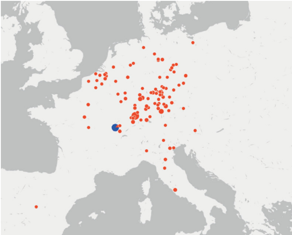
Abb. 3 Tätigkeitsorte (orange) der Gelehrten im RAG mit einem Studienaufenthalt in Dôle (blau)