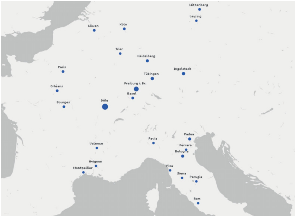
Abb. 2 Studienorte der Gelehrten im RAG mit einem Studienaufenthalt in Dôle